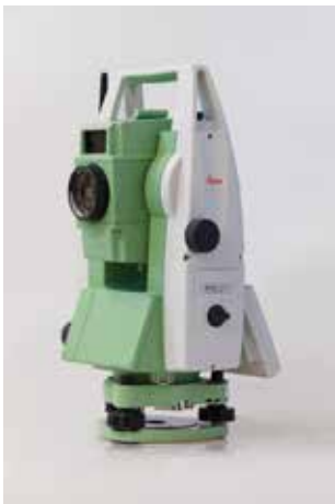
Sodobni elektronski tahimeter Leica Geosystem 2012.

Obdobje po drugi svetovni vojni so na področju katastra s tehnološkega vidika zaznamovali predvsem razvoj elektronskih tahimetrov, razvoj opreme za kartiranje in fotogrametrija.