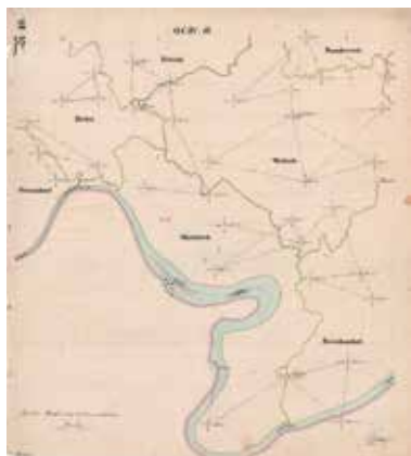
Načrt geodetske mreže za katastrsko izmero, izdelan v originalnem merilu 1 : 28.800 - okolica Vač.