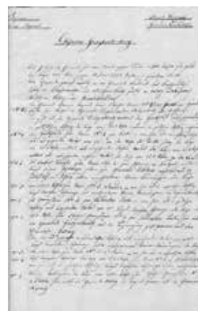
Skica (levo) in izsek opisa (desno) meje katastrske občine Kostanjevica na Krki (nem. Landesstrass) na Kranjskem iz let 1824/1825 (Arhiv Republike Slovenije).

Detajlna katastrska izmera se je izvedla na podlagi prikazanih zemljiških posestnih meja, ki so jih posestniki predhodno označili z lesenimi količki ali drugimi znamenji. Merilo katastrskih načrtov je bilo praviloma 1 : 2880, za naselja so lahko uporabljali merilo 1 : 1440 ali celo 1 : 720, v hribovitih in gorskih predelih pa merilo 1 : 5760. Vsi katastrski načrti so bili umeščeni v geodetski koordinatni sistem – na območju današnje Slovenije so to bili: