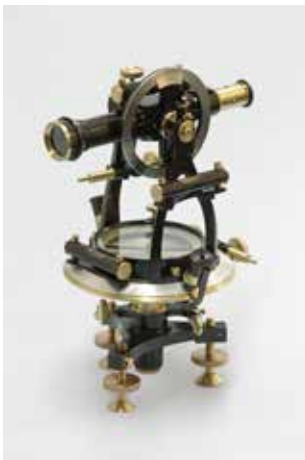
Teodolit Neuhöfer & Sohn, Dunaj, okoli leta 1900 (Slovenska geodetska zbirka na gradu Bogenšperk).

Na vzdrževanje in vzpostavitev zemljiškega katastra sta imela velik vpliv razvoj geodetskih instrumentov ter napredek v metodologiji geodetske izmere in kartiranja. Prvotna katastrska izmera iz 19. stoletja je bila utemeljena na tako imenovani grafični metodi izmere, kjer so se načrti izdelovali neposredno na terenu z uporabo merske mize. Mersko mizo so na območju današnje Slovenije ukinili sredi 20-ih let preteklega stoletja. Že pred tem je staro grafično metodo izmere počasi nadomestila geodetska izmera z uporabo teodolitov in druge merske opreme.