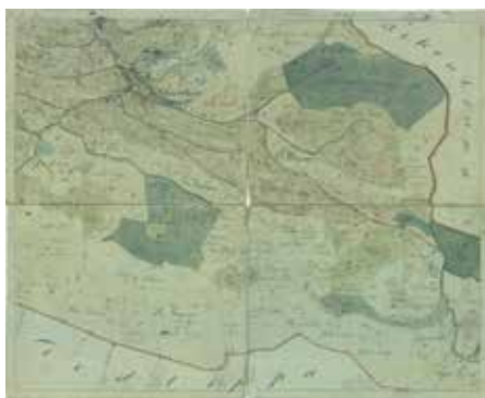
Terenska indikacijska skica z opisnimi podatki o parcelah in posestnikih v katastrski občini Žažar (Arhiv Republike Slovenije).