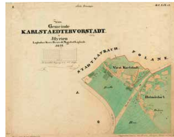
Franciscejski kataster za Kranjsko - načrt za Karlovo predmestje, 1825..

Z izmero in kartiranjem so bili zbrani številni podatki. Tako je bil za vsako katastrsko občino pripravljen tudi seznam zemljiških parcel, seznam stavbnih parcel, abecedni seznam posestnikov, izkaz površine zemljišč po katastrskih kulturah, seznam parcel nepoznanih posestnikov in zapisnik o izračunanih površinah, pozneje tudi pismene navedbe davkarije o davčnih zavezancih. Pomembno je poudariti, da so bili katastrski načrti pomensko izredno bogati, tako so na primer ločili lesene stavbe (oker barva) od zidanih (roza barva), javne zidane stavbe so bile temnejše obarvane, za vse stavbe pa je bila z odebeljeno črto prikazana stran vhoda. Ločili so med stavbnimi in zemljiškimi parcelami, posebne parcele so predstavljale komunikacije (ceste, vodotoki).