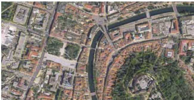
Digitalni katastrski načrt z državnim ortofotom, Ljubljana leta 2017 (Geodetska uprava RS).

Na prehodu v novo tisočletje so posebne izzive za razvoj zemljiškega katastra prinesli digitalizacija ter nove metode geodetske izmere, ki slonijo na globalnih satelitskih navigacijskih sistemih.